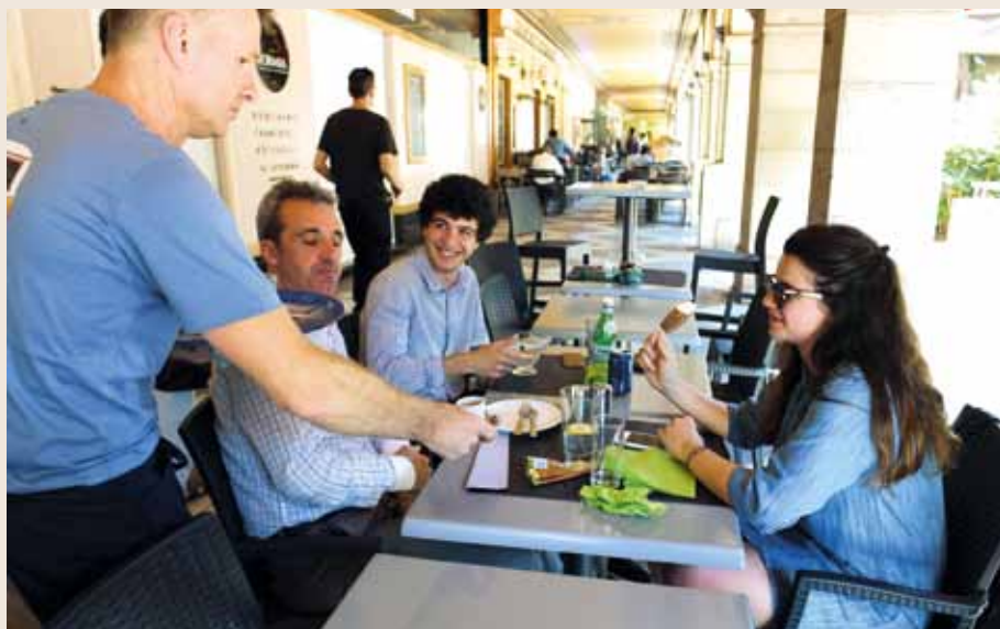
En Principauté, 56 % des offres d'emploi annuelles du secteur de l'hôtellerie-restauration concernent le travail saisonnier.

En amont et pendant toute la saison estivale, le Service de l'Emploi de la Direction du Travail se mobilise afin de répondre aux besoins, alors croissants, des employeurs. Un travail conséquent, compte tenu de l'importance de l'activité touristique en Principauté durant l'été, qui débute dès le début de l'année.