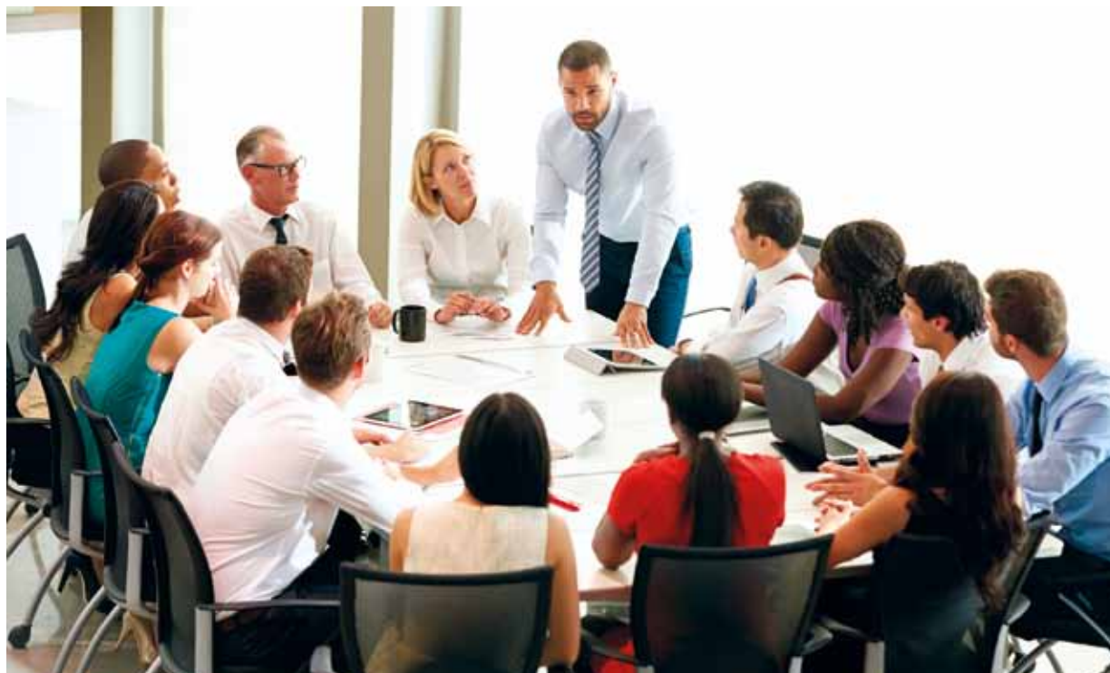
Présidées par le Directeur des Ressources Humaines et de la Formation de la Fonction Publique, les Commissions Paritaires assurent un rôle représentatif et consultatif. Se réunissant au moins une fois par an, elles traitent des questions d'ordre individuel.

A la suite des élections qui se sont déroulées du 18 au 21 avril, sont nommés, pour une période de 3 ans à partir du 17 juin, les membres des Commissions Paritaires suivants (Arrêté Ministériel n° 2016-338 du 24 mai 2016) :