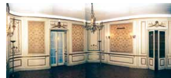
Le Salon d'honneur de la Croix-Rouge avant les travaux de rénovation...