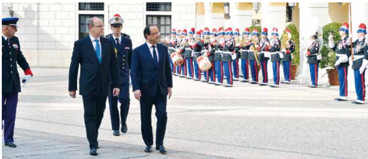
En 2013, le Président François Hollande accueilli par S.A.S. le Prince Souverain pour une Visite Officielle.

Consistant en l'accueil de personnalités et de délégations étrangères en Principauté, les Visites Officielles et les Visites de Travail nécessitent une importante préparation qui mobilise de nombreuses entités du Palais Princier et du Gouvernement dont, notamment, la Direction des Relations Diplomatiques et Consulaires.