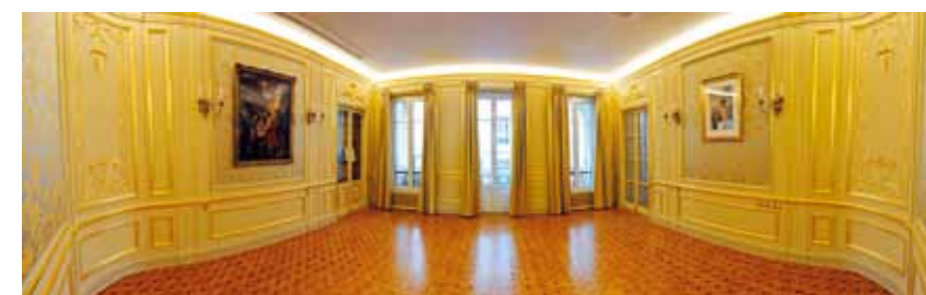
... et après.