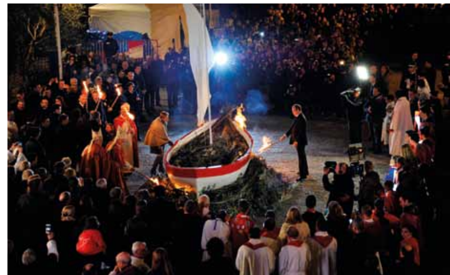
Parmi son patrimoine culturel immatériel, la Principauté compte les festivités de Sainte-Dévote (26 et 27 janvier).

Depuis maintenant plusieurs années, la Principauté est engagée dans l'élaboration d'un inventaire de son patrimoine culturel immatériel dont la coordination est assurée par la Direction des Affaires Culturelles (DAC). Point d'étape sur cette importante action pour l'héritage local. Et définition du patrimoine culturel immatériel.