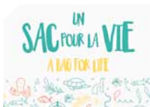
DEEU - L'interdiction des sacs en plastique à usage unique