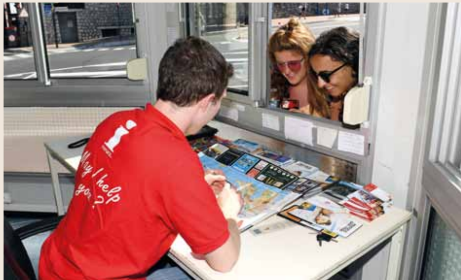
4 points d'informations, en plus des 2 bureaux d'accueil de la DTC, sont à la disposition des touristes de la Principauté durant la saison estivale.

Face à l'afflux de touristes en période estivale, la Direction du Tourisme et des Congrès (DTC) ouvre des points d'informations supplémentaires afin d'accroître sa capacité à les renseigner. Des dispositifs qui nécessitent notamment le recrutement et la formation de personnels dédiés.