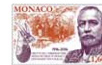
Dessin et gravure : Yves BEAUJARD Impression : Taille-douce 3 couleurs Format du timbre : 52 x 31,77 mm horizontal Tirage : 45.000 timbres-poste Feuille de 10 timbres-poste avec enluminures Tarif : 1,60 €

L'année 2016 marque le centenaire des 1 ères fouilles réalisées à la grotte de l'Observatoire du Jardin exotique, qui ont mis en évidence les plus anciennes traces d'occupation humaine à Monaco.