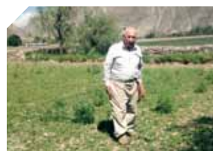
DREC - Le bilan du Défi Solidaire