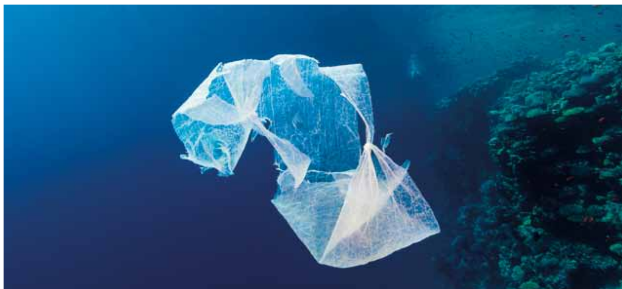
La pollution des océans par les sacs en plastique est l'un des pires fléaux environnementaux.

En vigueur depuis le 1 er juin, l'interdiction d'utilisation de certains sacs en plastique en Principauté est une mesure qui s'inscrit dans une démarche environnementale plus large dont le pilotage est assuré par la Direction de l'Environnement. Zoom sur les différentes étapes de mise en œuvre de cette décision.