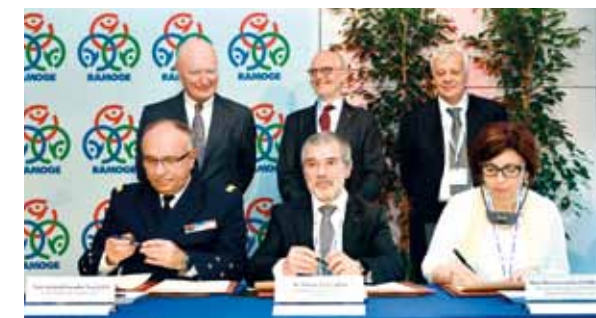
Visite de Travail, dernièrement organisée en Principauté à l'occasion du 40 e anniversaire de l'Accord RAMOGE, qui a notamment permis d'amender le texte initial dudit Accord.