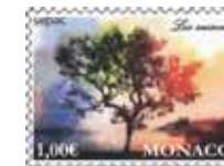
Dessin : Joël TCHOBANIAN Impression : Offset Format du timbre : 40,85 x 30 mm horizontal Tirage : 50.000 timbres-poste Feuille de 10 timbres-poste avec enluminures Tarif : 1 €

Cette année, le thème des émissions des Administrations postales membres de la SEPAC (Small European Postal Administration Cooperation) est « les saisons ». Le timbre monégasque offre une vision très poétique du Rocher.