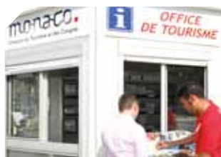
DFE - L'accueil et l'information touristique