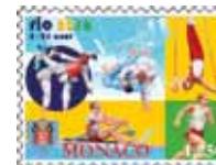
Dessin : David MARASKIN Impression : Offset Format du timbre : 40,85 x 30 mm horizontal Tirage : 50.000 timbres-poste Feuille de 10 timbres-poste avec enluminures Tarif : 1,25 €

Lors des 1 ers Jeux Olympiques d'été en Amérique du Sud, la Principauté présentera des compétiteurs dans 6 disciplines : l'athlétisme, l'aviron, la gymnastique artistique, le judo, le taekwondo et la voile.